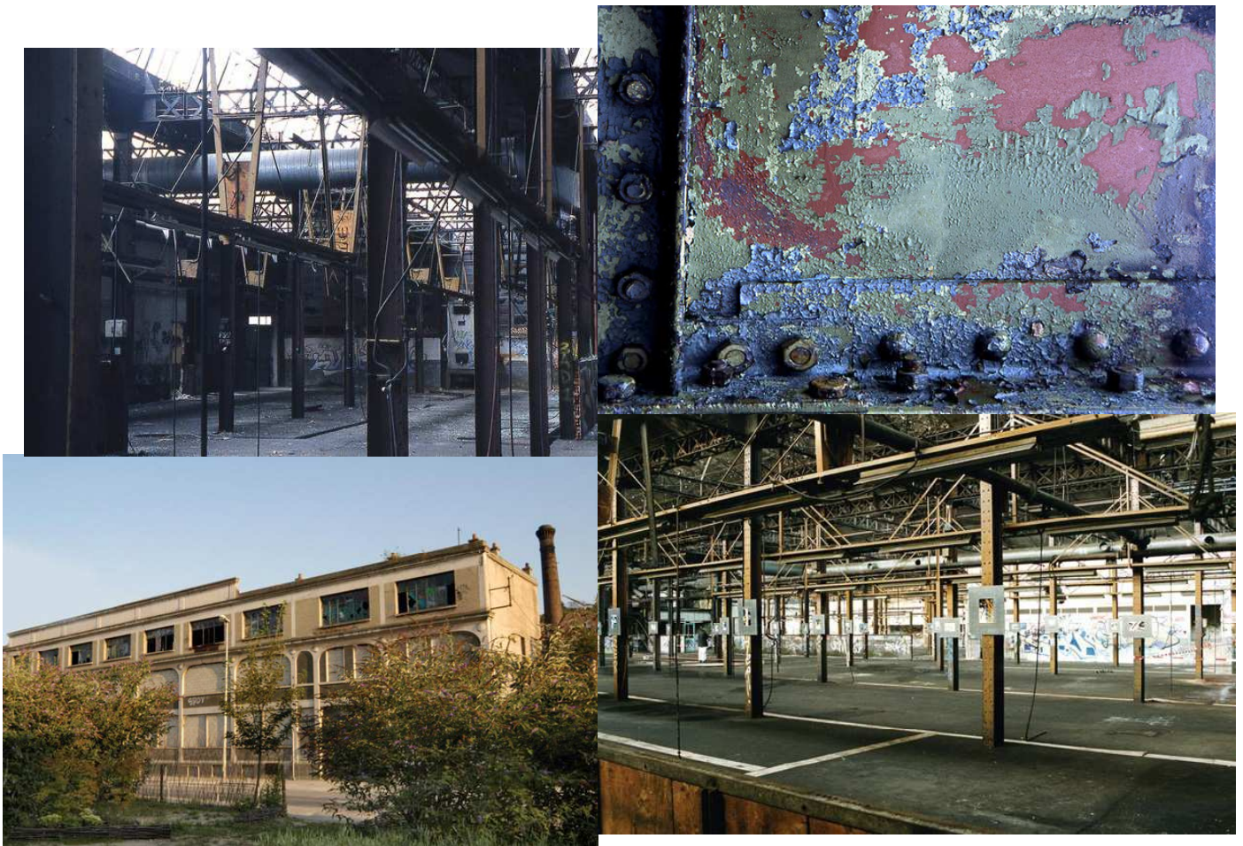
Usine Gaupillat Libre interprétation de l'artiste