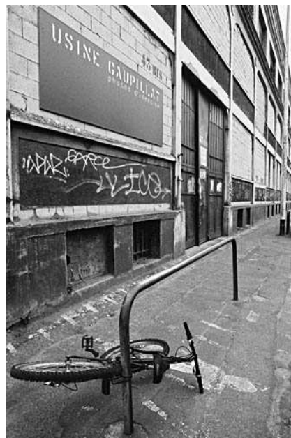
Usine Gaupillat images.google.fr Libre interprétation de l'artiste

générale, les gens se sont rendu compte de l'importance de la réhabilitation du site et des bienfaits de l'existence d'un pôle d'animation culturelle qui respecte à la fois le patrimoine et les attentes urbaines. L'association doit ce succès à l'investissement de ses ressources humaines ainsi qu'à la mise en place, depuis le départ, d'une communication de qualité qui a permis de valoriser le projet et de le faire accepter. En effet, un soin particulier a été porté sur les outils de communication (plaquette, documentation, site), ce qui a permis de convaincre que le projet avait lieu d'exister. Depuis ces deux dernières années, la communication a donc été le vecteur premier de progression pour l'association. Aujourd'hui, La Fabrique présente un bilan positif à propos duquel il n'y a rien à redire.