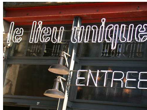
le lieu unique Entrée quai Ferdinand Favre 44013 Nantes

La pluralité des utilisations est allée à la pluridisciplinarité culturelle (concerts, arts graphiques, bal des beaux dimanches) et au métissage entre cultures -arabe et maghrébine, sud américaine, indienne, européenne, etc.- ainsi qu'au brassage générationnel. Le centre culturel se fait fort de préserver la mémoire