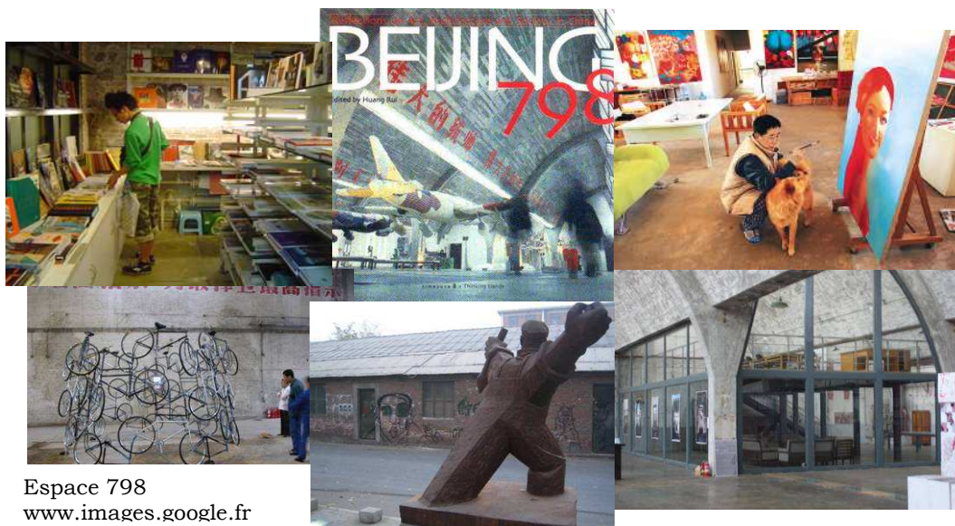
Espace 798 www.images.google.fr