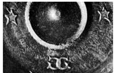
Culot de 11 mm Gras marqué du monogramme caractéristique, les deux G entrelacés de " Gévelot Gaupillat ".

Spécialisée dans la fabrication d'amorces, de cartouche de chasses, de bouchons de grenades et de détonateurs, ils font alors construire l'usine qui se trouve au 43 bis Route de Vaugirard. C'est un succès économique ! Après la Première Guerre mondiale, elle détient un quasi-monopole dans son secteur et d'autres activités s'y développent alors (fabrication de porte-mines, de pompes à vélo, de meubles en tubes, etc.)